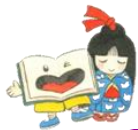
半田市立図書館キャラクター ブックんとしおりちゃん

2021年 3月 第133号 (月1回発行) 半田市立図書館 tel 0569-23-7171 亀崎図書館 tel 0569-29-5060