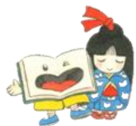
半田市立図書館キャラクター ブックんとしおりちゃん

2021年 1月 第131号 (月1回発行) 半田市立図書館 tel 0569-23-7171 亀崎図書館 tel 0569-29-5060