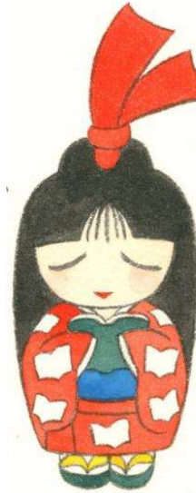
半田市立図書館キャラクター しおりちゃん