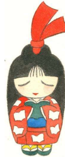
半田市立図書館キャラクター しおりちゃん