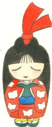
半田市立図書館キャラクター しおりちゃん