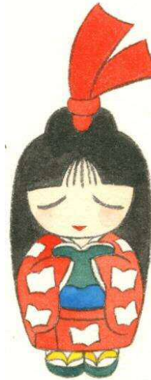
半田市立図書館キャラクター しおりちゃん

ちょうみりょう 赤くてからい調味料のタバスコは、何を発酵させて作られているでしょうか？