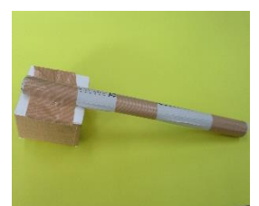
⑤棒を④の裏側に張り付けて出来上がり