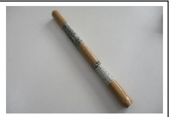
④ガムテープを巻いて出来上がり