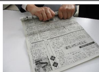
③つながっている方からきつめに巻く