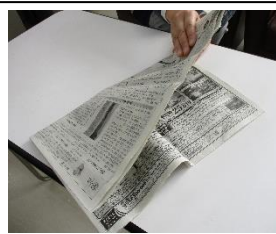
②もう一度半分に折る