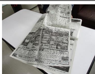
①新聞紙を半分に折る