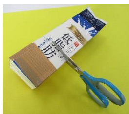
②ガムテープから3cmの所に線を引いて切る