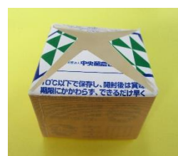
④4つの三角を内側に折る