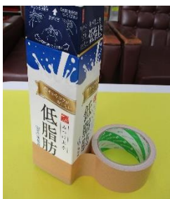
①パックの底にあわせて、ガムテープを1周巻く