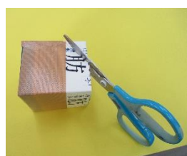
③切り口からガムテープに向かって、三角に切る