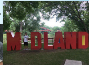
※平成30年度派遣生徒の様子

参加者負担金 20万円～23万円程度(航空券代等により変動。パスポート取得、旅行損害保険料は別途かかります。)