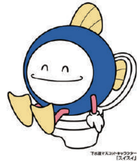
下水道課のキャラクター「スイスイ」