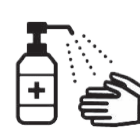
手指消毒用アルコールによる消毒の励行

この情報は11月16日時点のものであり、変更になる場合があります。 最新情報は、市ホームページをご確認ください。