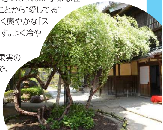
樹齢150年ほどにもなる白モッコウバラの木