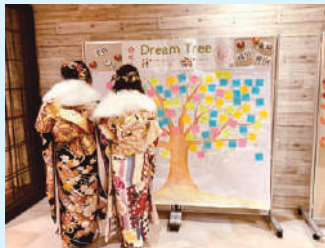
▲お祝いメッセージを見る新成人

成人式当日は、クラシティ、半田赤レンガ建物、春扇楼末廣、半六庭園・旧中荻半六邸、國盛酒の文化館などの市内の主要スポットが、感染症対策を万全に施すなかで、新成人のための休憩所や写真撮影など、一生に一度の思い出づくりの場として提供されました。