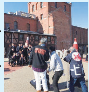
▲記念の写真撮影 (半田赤レンガ建物)

半田まちなか成人式応援隊としては、今後も、まちの人達が新成人に「おめでとう」とお祝いし、新成人からは、「今まで見守ってきてくれてありがとう」と感謝を伝えることができるような、心が通い合う温かいまちづくりを進めていきたいとのことです。