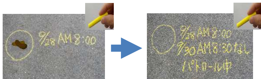
フンの放置を発見