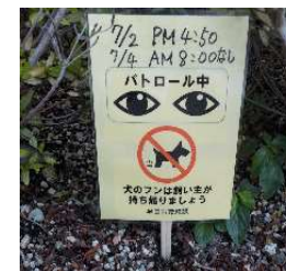
フンが片付けられたのを確認

カードにセロテープを貼ったり、ラップで巻いた上にマジックで確認日時を記入すると、再利用が可能です。