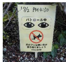
フンの放置を発見