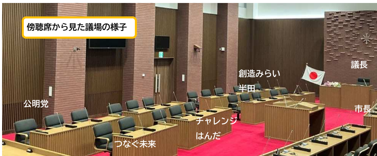
傍聴席から見た議場の様子