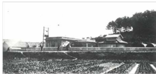
昭和5年 第1水源池（旧星崎浄水場）

本市の水道事業は、昭和4年2月に創設の認可を受け、昭和5年7月に通水を開始し、これまで5期にわたる拡張事業を実施しています。平成9年度までは、一部自己水源による浄水・配水を行っていましたが、現在は全て県営水道から受水し、市内へ配水しています。県営水道は、平成6年の大湯水を経て、平成10年4月に飲み水の水源が長良川に切り替えられました。