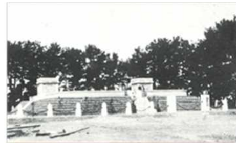
昭和5年 雁宿配水池（雁宿公園内）