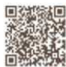
半田赤レンガ建物 Instagram

https://www.instagram.com/akarenga_handa/ https://www.instagram.com/akarenga.kikaku/