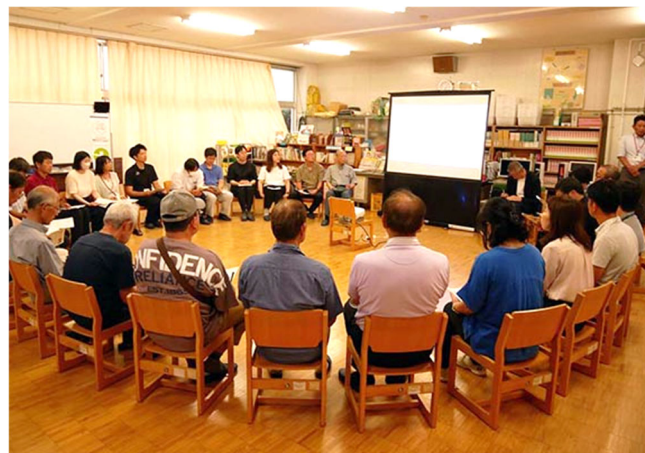
Season2からの新規参加者も加わって、「くるま座」でスタート

こうして落とし込んでいくと、新たにいろいろな問題が出てくる。その整理をしながら最終的に1案に絞った段階でまたみなさんに見ていただけたらと思っています！