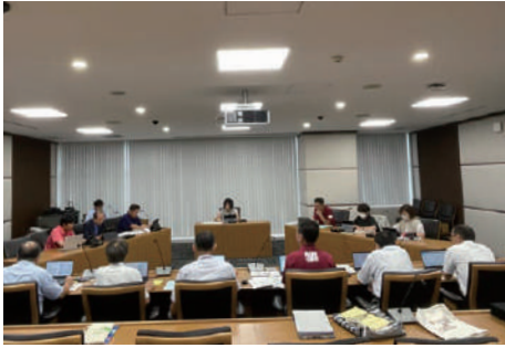
文教厚生委員会 決算審査の様子

答 令和4年度から全小中学校に対応できるようにしました。すべての要望・相談に対応はできていません。この状況をふまえ、スクールソーシャルワーカーの増員を検討していきます。