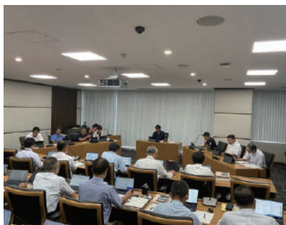
総務委員会 決算審査の様子

答 新たに医療技術局や経営企画室を設け、各部門の横断的な連携の強化や戦略的な病院経営を図れたこと、職員の休暇取得数が増え満足度向上に繋がったことなどが評価できると考えています。