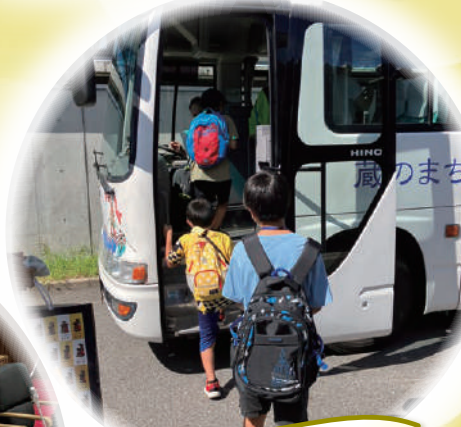
バスに乗って移動