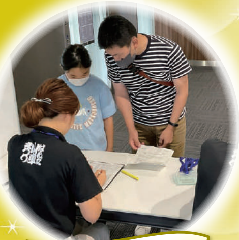
受付からスタート!