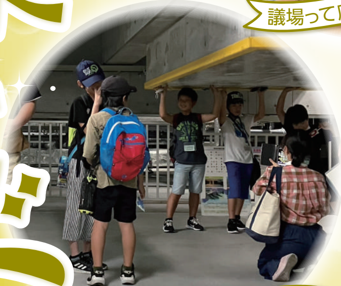
市役所の地下に来たよ!