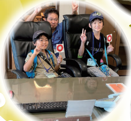
議長になった気分