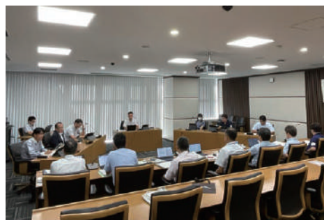
建設産業委員会 決算審査の様子

答 阿久比町とは、道路を拡幅するために暗渠化する水路の構造や野崎交差点の形状など、詳細な設計内容について、また、名古屋鉄道とは、鉄道桁下防護の構造や設置位置、近接作業の方法等について協議を行いました。