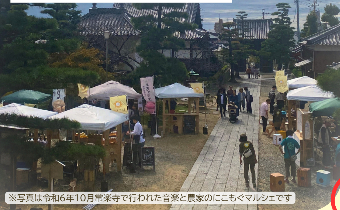
※写真は令和6年10月常楽寺で行われた音楽と農家のにこもぐマルシェです