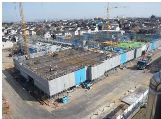
令和4年3月16日の状況(北西から南東を望む)

さて、現在の工事進捗は、建物1階部分のコンクリートの打設が進み、建物の形が徐々に出来上がってきました。引き続き、コンクリートミキサー車、ダンプカーが通行します。搬入出時にはご迷惑をおかけしますが、ご理解