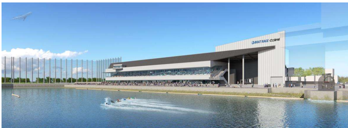
南側(水面側)イメージ図