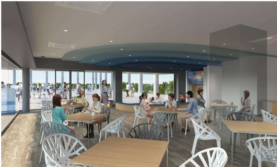
1Fファミリールーム