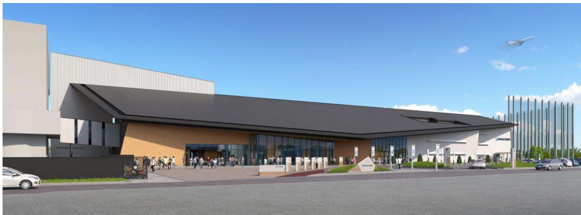
北側(入口側)イメージ図