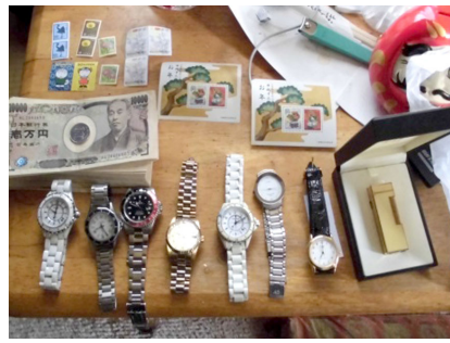
滞納者の自宅を搜索する様子

29年度市税収納率(現年)は99.80%です。公平性の観点から督促状の納期限内に納付されないと勤務先や金融機関などに調査を行い、預金、給与、不動産、生命保険などの財産を差押する場合があります。また、市営住宅入居や国保保険証発行など、行政サービスの制限を受ける場合がありますので、必ず納期限内に納付してください。