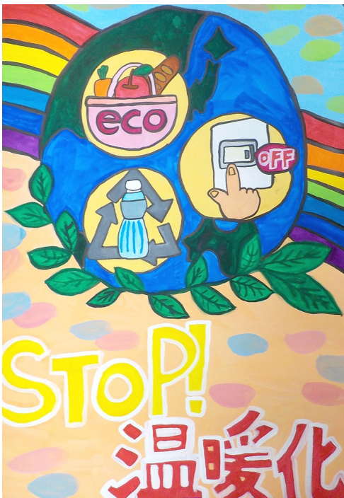
▲平成30年度環境保全ポスターコンクール 小学生の部 最優秀賞作品

私たちの暮らしは、昔に比べ便利で快適なものになりました。しかし、それは同時に「地球温暖化」という大きな環境問題をもたらしました。日々の生活の中では、なかなか実感できませんが、地球温暖化は確実に進んでいます。例えば、名古屋地方気象台によると名古屋市の年平均気温は、100年あたり2.1℃上昇しています。