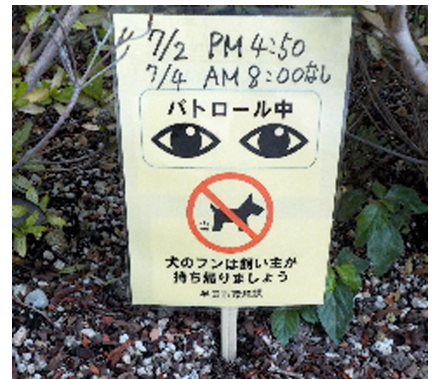
イエローカードの例