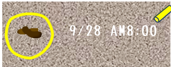
イエローチョークの例