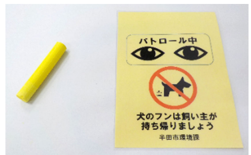
イエローチョークとイエローカード

必要なイエローチョークやイエローカードは、環境課で使用方法を記載したチラシとともに無料でお渡しします(窓口にお越しいただく前にご連絡をいただければスムーズにお渡しできます)。