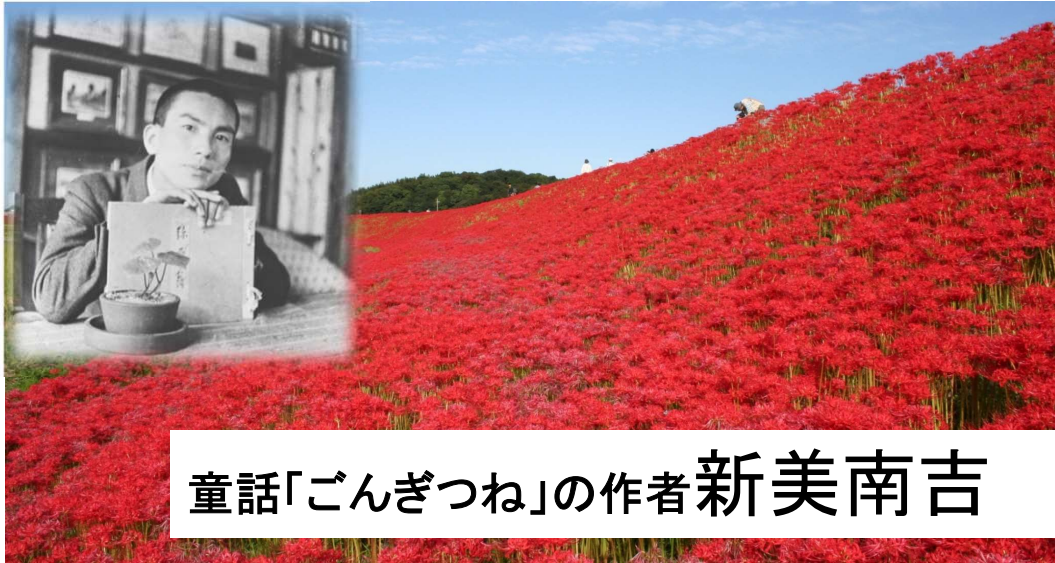
童話「ごんぎつね」の作者新美南吉