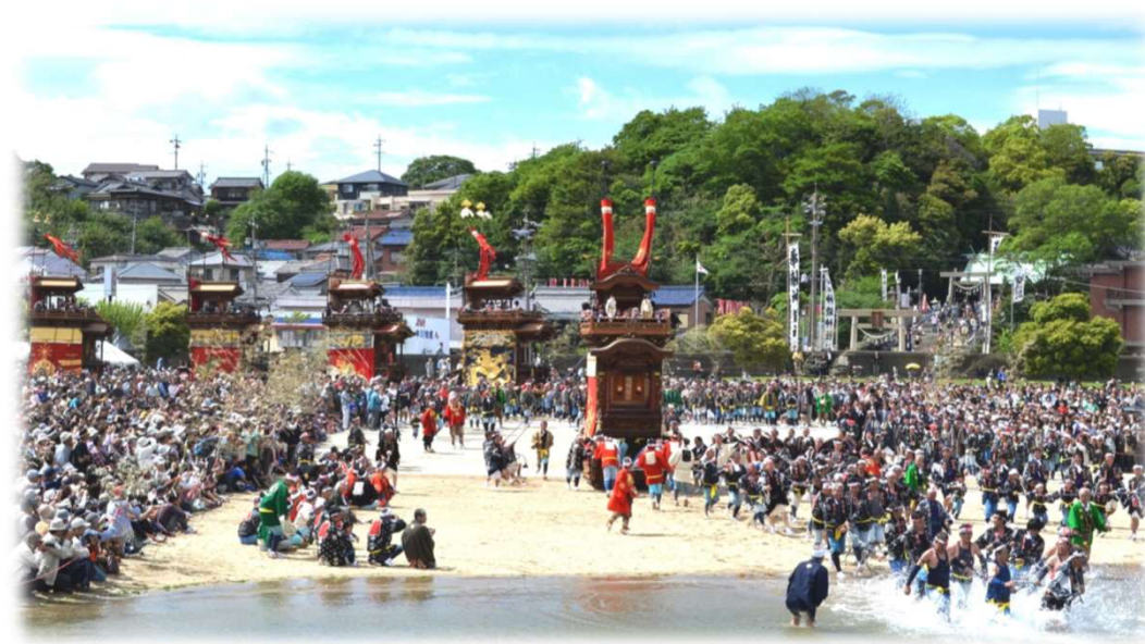
亀崎潮干祭の山車行事