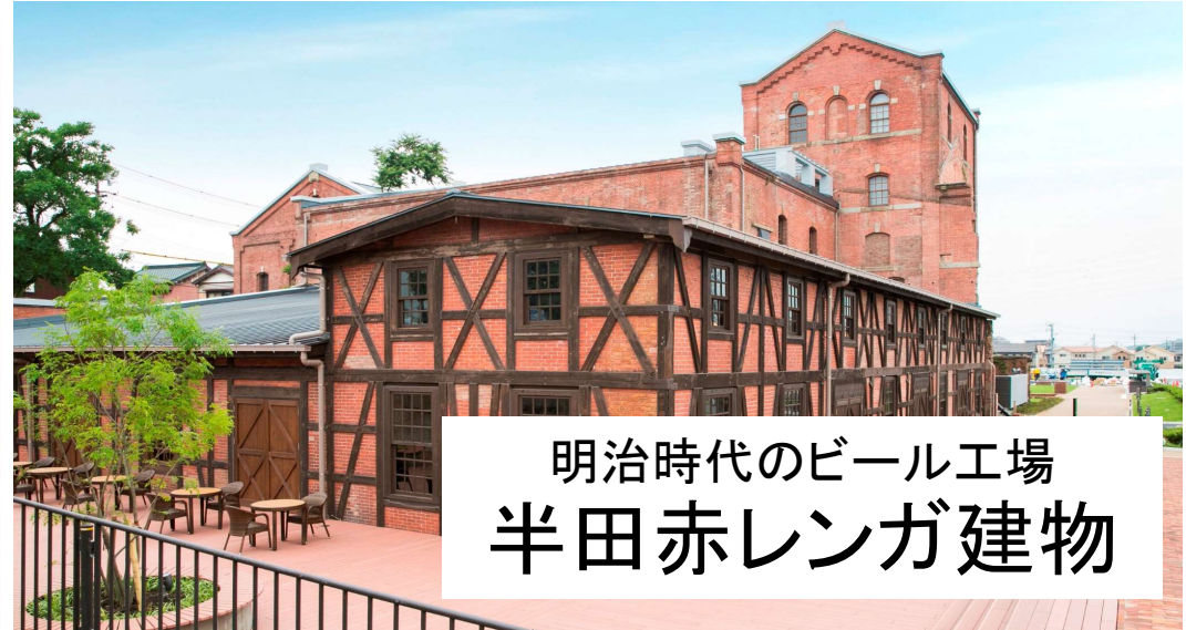
明治時代のビール工場 半田赤レンガ建物