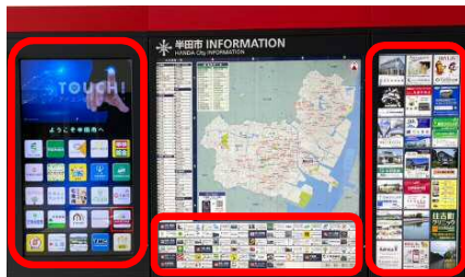
（市役所1階市民ロビー 市役所内案内地図板）

約200,000人（市役所庁舎）、約160,000人（雁宿ホール）、約330,000人（半田病院）