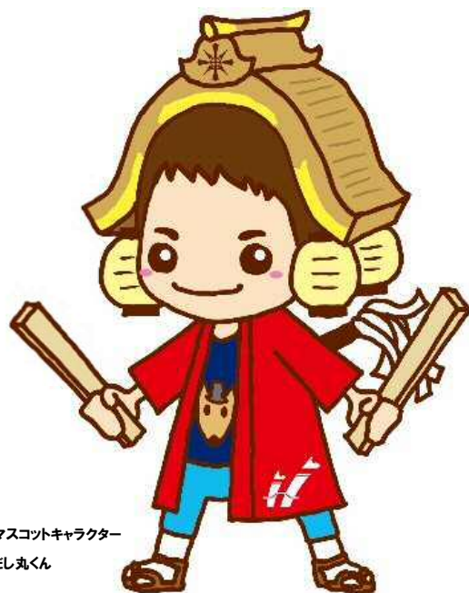
半田市観光マスコットキャラクター だし丸くん

半田市では、さまざまな媒体を活用して広告事業を展開し、市民のみなさんを中心に、多くの方にご覧いただいています。