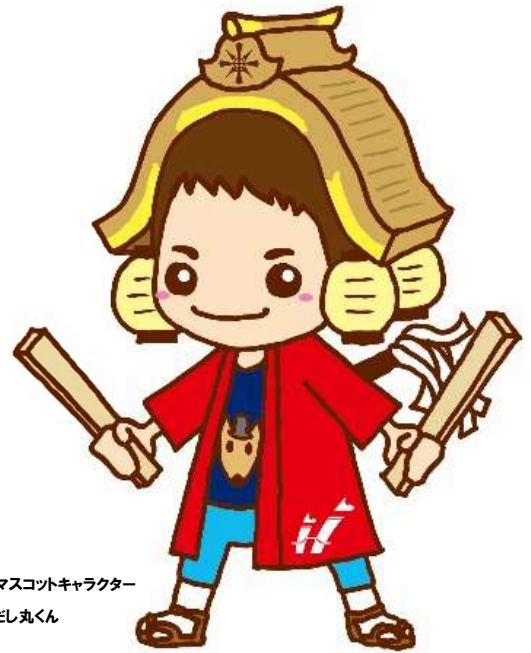
半田市観光マスコットキャラクター だし丸くん

半田市では、さまざまな媒体を活用して広告事業を展開し、市民のみなさんを中心に、多くの方にご覧いただいています。