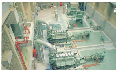
▲ポンプの設置状況