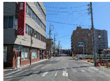
現況写真 (御幸通り)

(※共同溝とは、道路の地下に設置する電力線や通信線等の電線類をまとめて収容するもの)