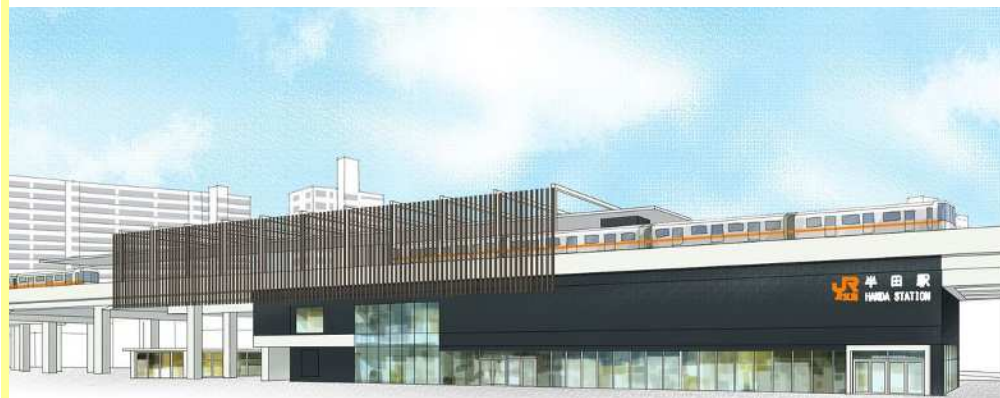
※駅舎完成イメージ（半田市作成）

皆様には、工事などによりご不便をおかけしておりますが、引き続きご理解とご協力をお願いいたします。