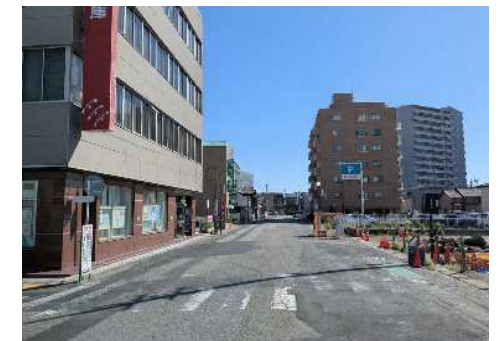
無電柱化後イメージ (御幸通り)