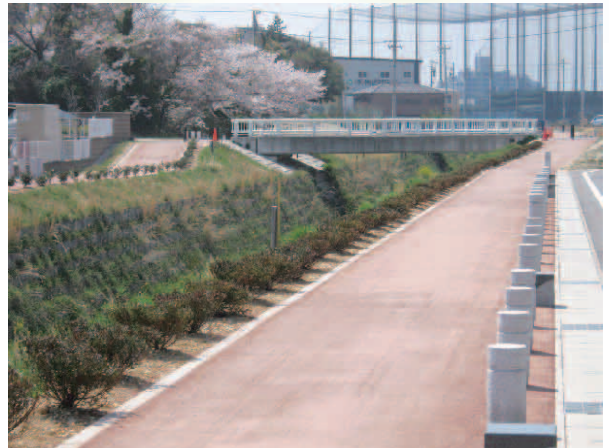
平成20年度に整備した平地川沿い(寄鷺橋付近)の歩道