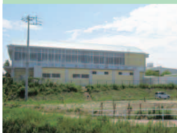
乙川東小学校（体育館）