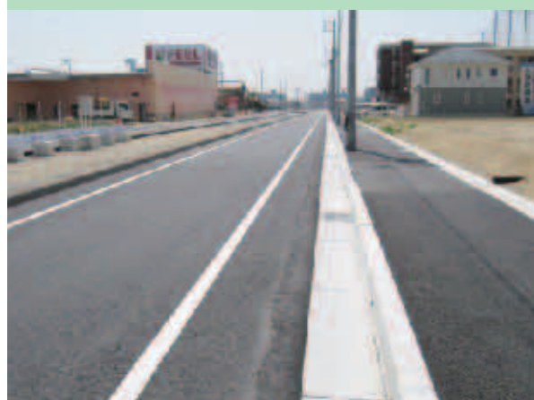
都市計画道路（環状線）