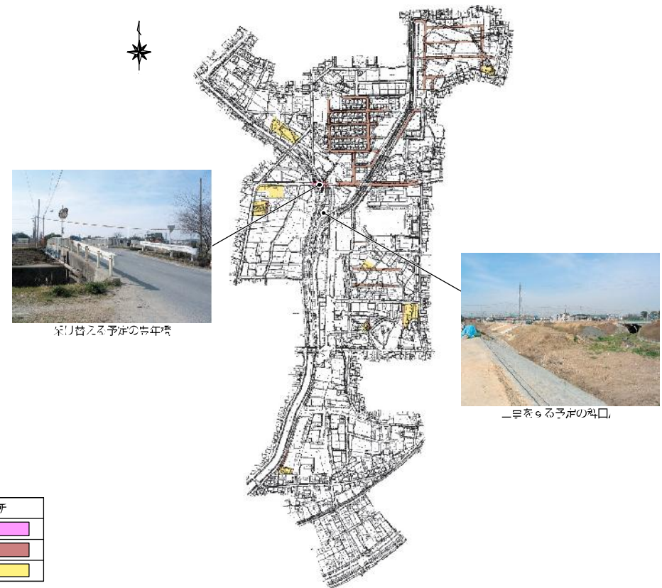
平成19年度に整備する予定

工事中は通行規制など、いろいろとご迷惑をお掛けしますが、ご理解ご協力をよろしくお願いいたします。