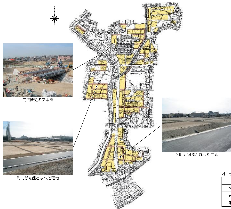
平成18年度までに整備したところ

平地川にかかる4橋（小和田橋・平地橋・奇鷲橋・海老洗橋）については既に完成し、平成18年度には稗田川にかかる庚申橋が完成しました。