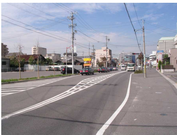
基幹事業：道路：荒古線(1)