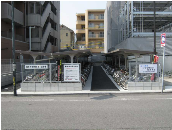
基幹事業：地域生活基盤：駐輪場（1）