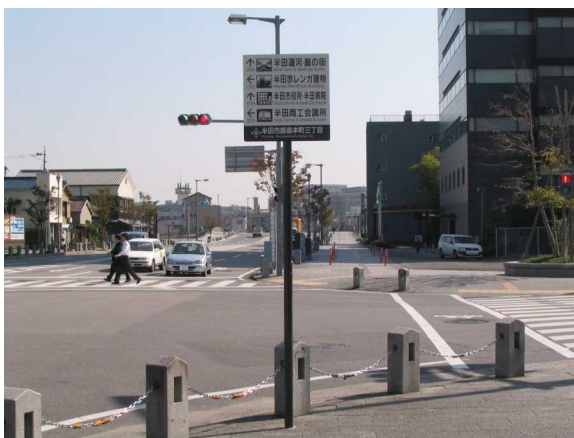
基幹事業：地域生活基盤：サイン(3)