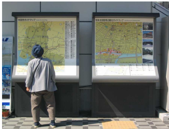
基幹事業：地域生活基盤：案内板（1）