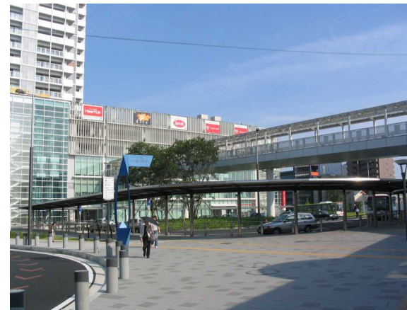
基幹事業：高質空間：シェルター（2）