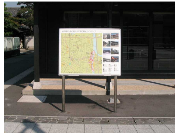
基幹事業：地域生活基盤：案内板（2）