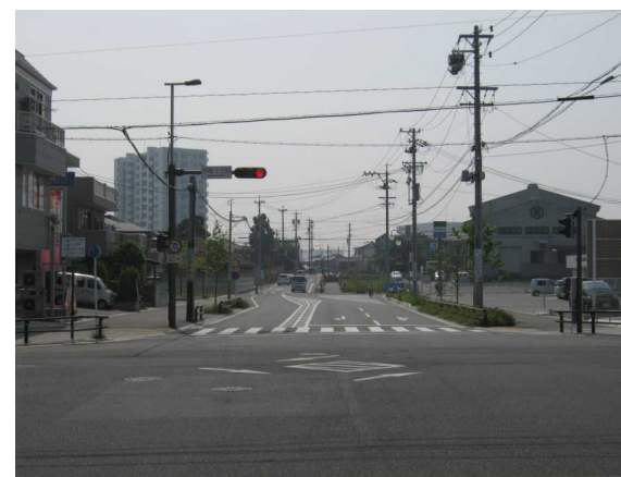
基幹事業：道路：荒古線(2)