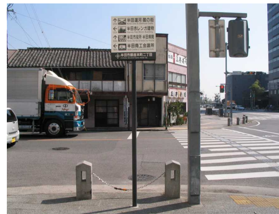
基幹事業：地域生活基盤：サイン(2)