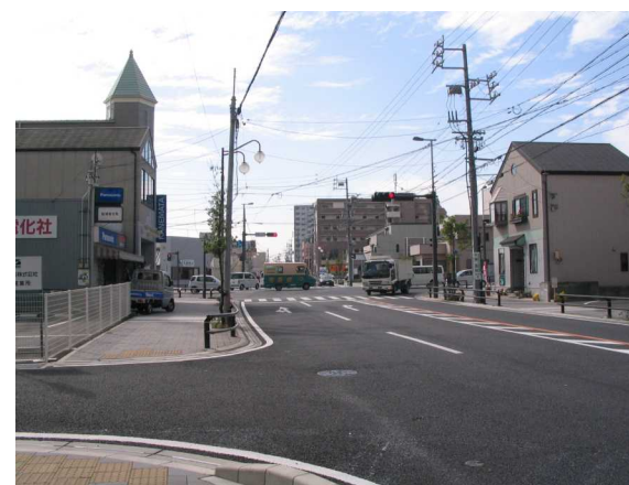
基幹事業：道路：名古屋半田線(2)