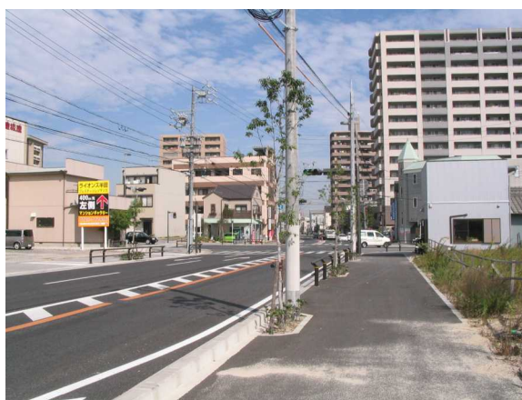
基幹事業：道路：名古屋半田線(1)