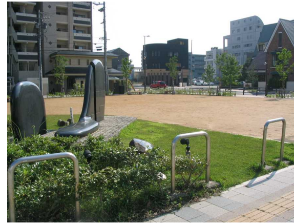
基幹事業：公園：おおまた（2）