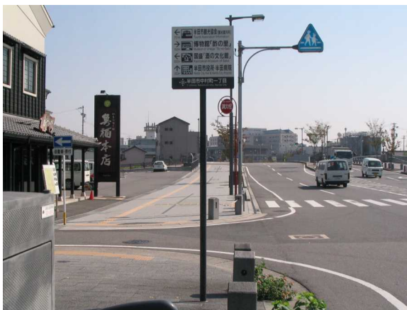
基幹事業：地域生活基盤：サイン(1)