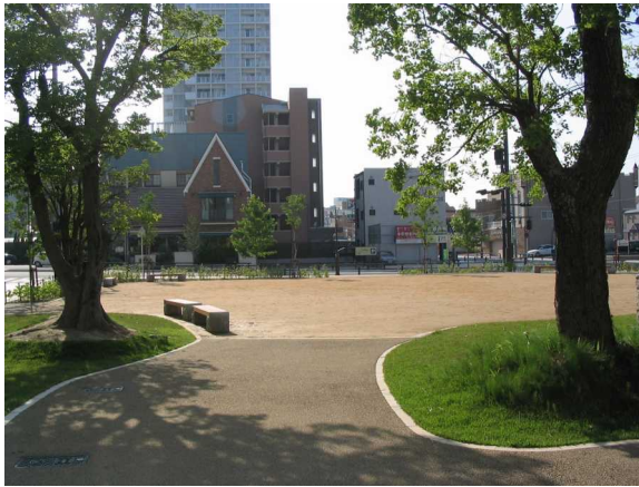
基幹事業：公園：おおまた（1）