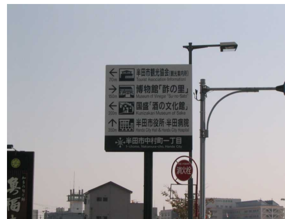
基幹事業：地域生活基盤：サイン(4)