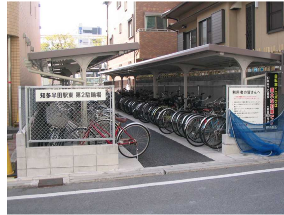
基幹事業：地域生活基盤：駐輪場（2）