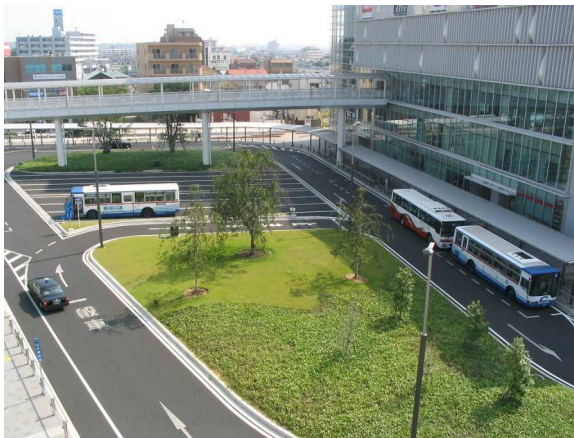
基幹事業：高質空間：シェルター（1）