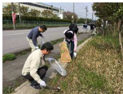
はんだクリーンボランティア