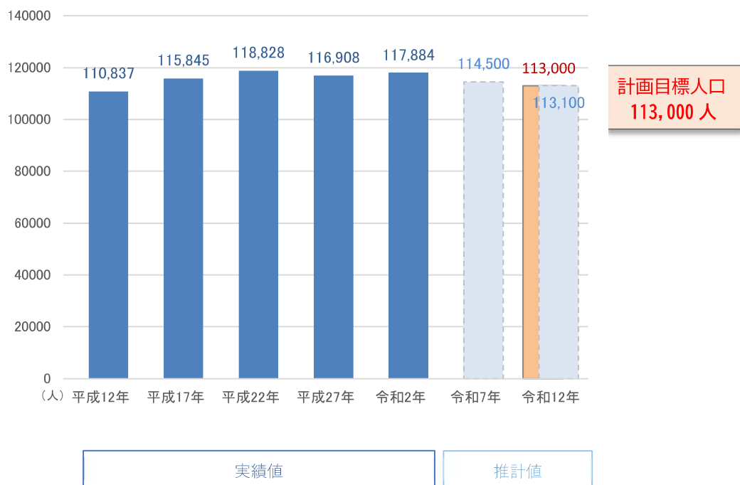
■将来の人口フレーム