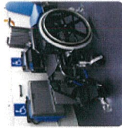
車内が広く、車内には車いすの乗客が安心して乗れるよう、座席の間隔を広く確保しています。

自動巻取り式ベルトを採用したため、 乗客の固定が可能。また、 車いすの固定と固定が可能なよう、車内左側前方に すぐに取付け可能なよう、車内左側前方に 収納ボックスを設けました。