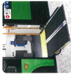
車内が広く、車内には車いすの乗客が安心して乗れるよう、座席の間隔を広く確保しています。

車いすの方にも安心して乗車いただける ように、折りたたみ式の車いす用スロープを 採用しています。