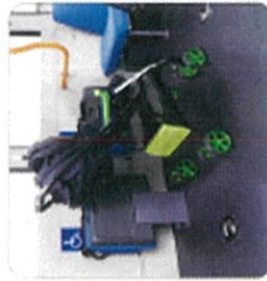
車内が広く、車内には車いすの乗客が安心して乗れるよう、座席の間隔を広く確保しています。

広い通路幅を確保したことにより、車いす スペースとしてだけでなく、お子様を ペーカリーに載せたままでの乗車が 可能です。