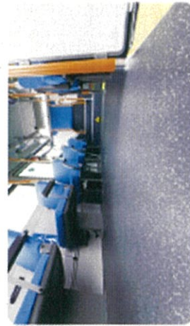
車内が広く、車内には車いすの乗客が安心して乗れるよう、座席の間隔を広く確保しています。