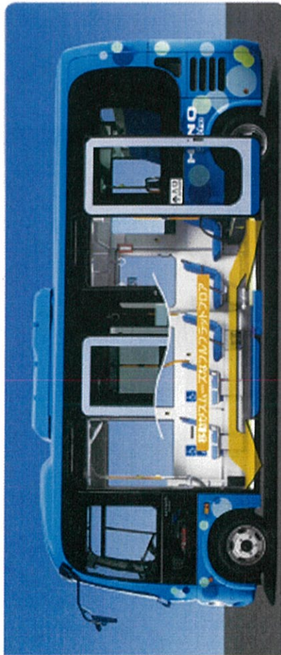
車内が広く、車内には車いすの乗客が安心して乗れるよう、座席の間隔を広く確保しています。