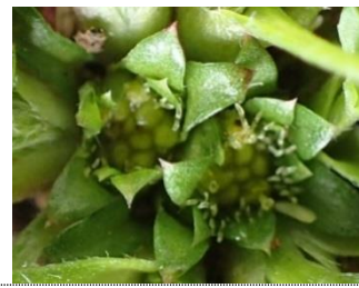
3月～4月 株の中心に花をつける