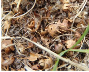
果実がバラバラになる