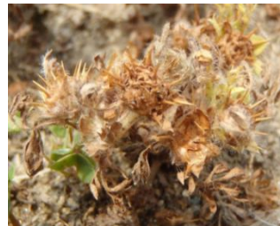
5月～7月 すべて枯死する