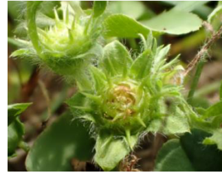
4月～6月 トゲのある果実をつける