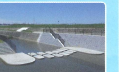
矢勝川の飛び石渡り