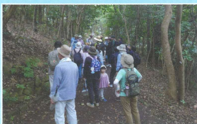
○アサギマダラに会えるかな（任坊山公園）④