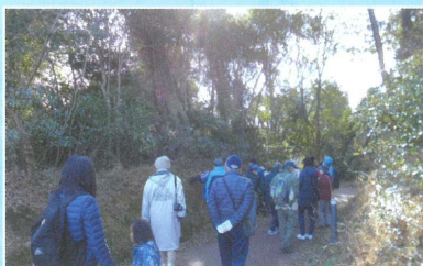
○冬越しをする虫たちの生活（任坊山公園）④