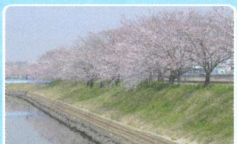
十ヶ川沿いの桜並木