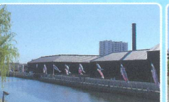
半田運河と鯉のぼり