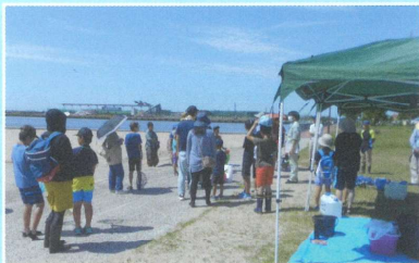
○亀崎海岸の生き物（亀崎海浜緑地）①