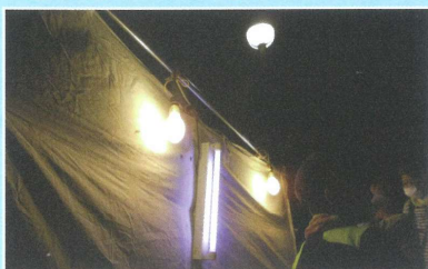
○ライトに集まる虫（半田びよログスポーツパーク）②