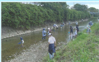
○神戸川の生き物（神戸川）③