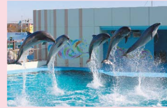
南知多ビーチランドペア入園券／えびせんパーク ベットん体験 他