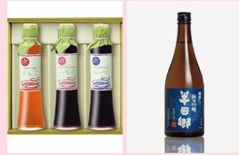
お酢の醸造蔵 三井酢店 詰め合わせギフト／國盛酒の文化館 國盛純米吟醸 半田郷酵母1801 (720ml) 他