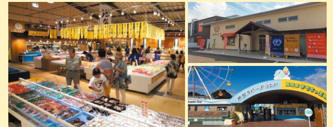
魚太郎、えびせんパーク、南知多ビーチランド、肉太郎・布土精肉など南知多町、美浜町の「海」やスポットを巡るラリーコースです。