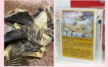
やまに旅館 ふぐひれ酒の素／海音貝飯