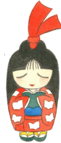
半田市立図書館キャラクター しおりちゃん