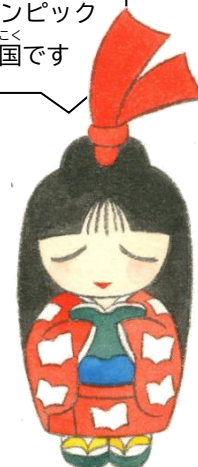
半田市立図書館キャラクター しおりちゃん