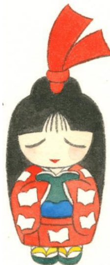
半田市立図書館キャラクター しおりちゃん