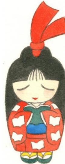
半田市立図書館キャラクター しおりちゃん