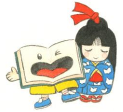
半田市立図書館キャラクター ブックんとしおりちゃん