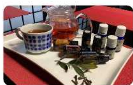
アロマセラピー・ ハーブティーレッスン/ Sweet Spice ~あまから~(濱口)《ラ5》

心と身体・オーラにも心地よいアロマセラピーとハーブティーのレッスンです。 香りに包まれる時間を楽しみませんか?