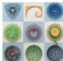
糸かけアート/浅井 安恵 《ア21》

運動苦手でもOK! 音楽に合わせて弾むバランスボールで楽しみながら心身を整え、『ご機嫌な私』に!