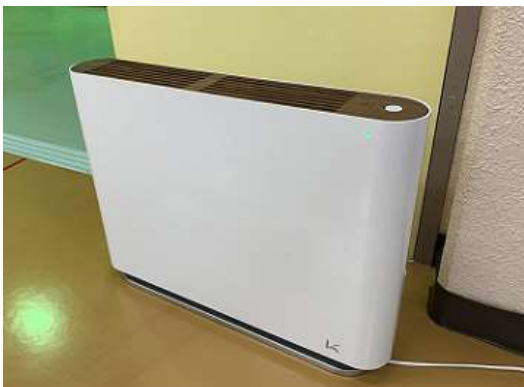
除菌・脱臭機〈大空間用〉