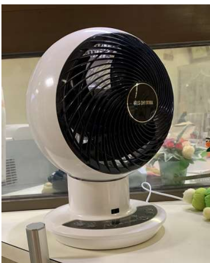
サーキュレーター 〈空気循環器〉