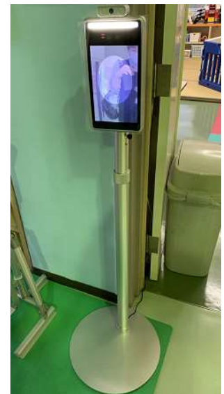
サーモメジャー 〈非接触式温度検知器〉