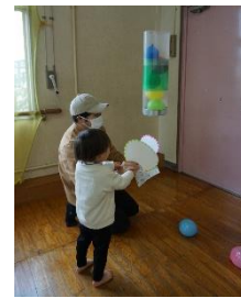
ふうせんを「あおぎつつす」