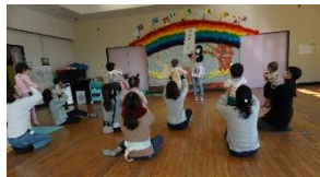
えほん「ぴよーん」みんなでやったよ