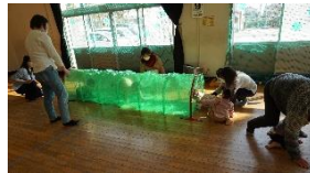
トンネルくぐったよ