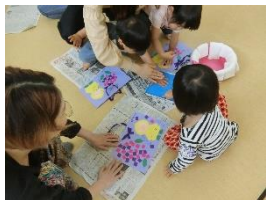
「雨降りぽったん」工作

◇職員と一緒に体操や手遊び、その日の活動など親子でふれあって遊びます。 ◇お母さん同士の交流が深まります。また、育児についての情報が交換できます。