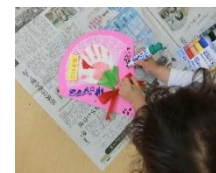
「手形で花束」 母の日工作