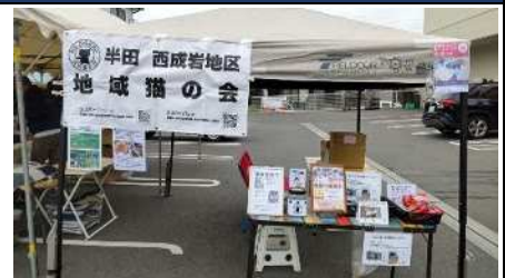
▲二つ坂カーニバル参加!

市内の公園で地域猫活動をしています。地域猫活動とは、飼い主のいない野良猫に避妊去勢手術をし、一代限りの猫として生涯を全うできるようにエサやりやシェルター維持管理、医療面での体調管理などを行っています。ボランティアさん募集中。エサやりの見学も可能です。猫好きな方、お待ちしております。