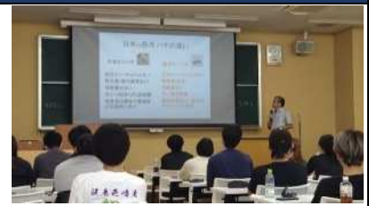
▲日本福祉大学で、本会の活動内容と日本ミツバチの生態を説明

知多半島日本ミツバチ愛好会は、ミツバチと共に暮らしやすい環境づくりを目指し、地域の自然と生物多様性の保全に取り組んでいます。多彩な活動を通じて、自然との共生を楽しみながら地域交流を深めています。持続可能な社会の実現に向けて、誰もが安心して参加できるコミュニティを提供しています。