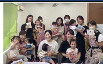
▲ランチ付きの親子サロン 「りんごびあであそぼ!!」

当法人は半田市岩滑地区において、たすけあいの心を大切に高齢者・障がい者・子育て等の支援を行っています。子ども食堂や学習支援、乳幼児を持つ親子を対象とした講座など楽しく育児ができるお手伝いをしています。また、昼食をはさんで交流を楽しむサロンなど地域に根差した様々な活動をしています。