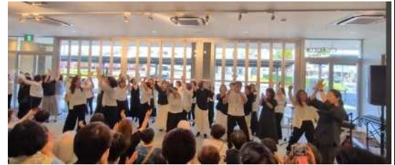
▲まちづくり協働フェスタ出演

映画「天使にラブソングを」で人気になったゴスペル♪その魅力はリズム溢れる音楽、そして歌声でつながる一体感！思いっきり声を出して、自由に身体を動かして、元気よくお腹の底から歌ってみましょう♪ジャンルや宗教観を問わず、どなたでも気軽に楽しめます♪（当会は宗教等には一切関係ありません）