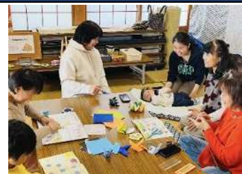
▲多世代交流の場 ふれあいスマイルサロン▲

毎月第1土曜日、乳幼児から年配者まで、多世代型のふれあいスマイルサロンを開催しています。親子クッキングや工作、季節のあそび、お抹茶コーナー等どなたでも参加して頂けます。子どもを真ん中に、おおらかに支え合う関係を育みながら、地域で多世代がつながる活動を目指しています。