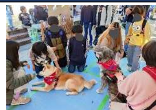
【ふれあい会】 犬を正しく学ぶイベントの様子▲