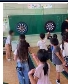
放課後子ども教室にてダーツ体験▶

親子で、孫と一緒に、障がいがあっても楽しめるダーツ。世代や障がいなどの違いを越えて一緒に楽しむことができます。様々な人と交流することで相互理解を深め、こころのバリアフリーを進めます。軽い運動や計算、様々な人とのコミュニケーションで健康促進にも。