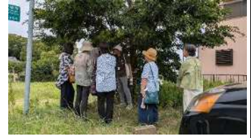
▲ごんぎつねの舞台（宝蔵倉の前）

半田市およびその周辺地域の歴史、文化、自然、伝統、観光資源等を市内外の人々に正しく、わかりやすく伝えることを目的とし、地域社会の発展と観光振興に寄与することを目指しています。