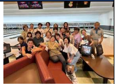
▲夏に行ったボウリング大会の写真

昭和55年創立、今年で46周年の手話サークルです。学習会では会員が交代で学習内容を担当し、手話を学んでいます。他にも季節の行事を通して親睦を深めています。「まちづくり協働フェスタ」では手話体験コーナーを行い、手話の普及啓発に取り組んでいます。仲間と楽しく学び交流できる場です。他にも知多地域の手話サークルとの交流会や、クリスマス会やいちご狩りなど季節の行事を通して、楽しく親睦を深めています。