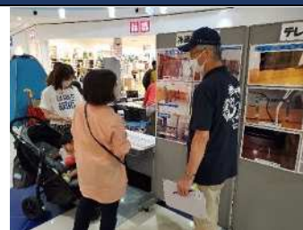
▲イオンモールでの家具固定啓発

あいち防災リーダー会 知多ブロックは、地域の防災力向上を目指し、防災講座や訓練、啓発などを通じて住民と共に「自分たちのまちを自分たちで守る」活動を行っています。