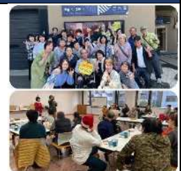
▲抹茶工場見学とクリスマス会の様子

サークルの公用語は【手話】。毎週の定例会では楽しい手話学習やゲームを通して、聴こえる聴こえないも年齢も関係なく会員同士の交流を深めています。お花見など、年に数回のお楽しみ企画も！毎年まちづくり協働フェスタに参加。手話の普及と、聴こえないことへの理解を広げる啓発活動をしています。