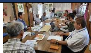
毎週開催している”サロン”の様子▲