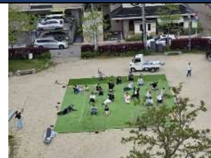
▲おおまた公園での人工芝張りワークショップの様子

はんだのたねは、創造・連携・実践の拠点「コココリン」を中心に、知多半田エリアのまちづくりを推進する団体です。起業・創業の支援、コミュニティ形成、公共空間の活用などを通して、誰もが自分らしい形でまちに関わり、地域に新しい価値が生まれる循環づくりに取り組んでいます。