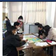
中高生とともに防災講座を開催▲

学生や大人たちのキャリアに関する相談や支援活動、外国人の子どもたちのための学習および居場所づくりのための活動を行っています。外国人のニーズに合わせて様々な教育、啓発活動を行っており、同じコミュニティで暮らす人々との共生を目指しています。