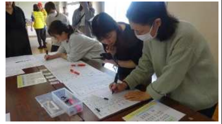
横川区民等を対象に災害対応運営ゲームを行いました▲

「防災・減災」の啓発活動を区民や他地区の団体、小・中学校、保育園・障がい者団体、外国人等を対象に行っています。オファーがあれば調整のうえ対応しますのでお気軽にご連絡ください。