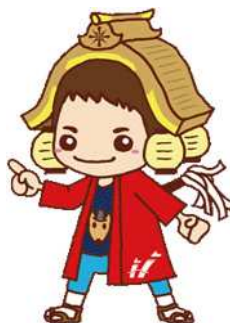
半田市観光マスコットキャラクター 「だし丸くん」