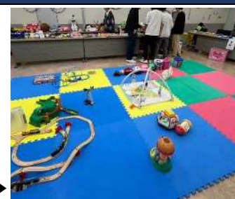
フリーマーケットを開催▶

「きみの世界をおもしろく」という理念のもと、知多半島の発達に不安のあるお子さんとそのご家族に対し、科学的根拠のある専門的療育と家族の支援を両軸に活動しています。