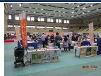
子ども虐待防止啓発活動の様子（知多市との協働）▲

また、半田市内では、子育て中の親子を対象としたふれあいいきいきサロン「ぴーすふる・すぱーす」を開催しています。