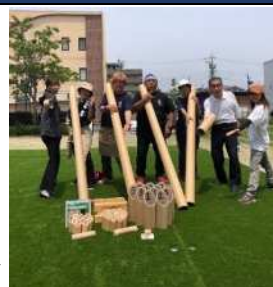
おおまた公園でジャンボモルック作ってみた▶

このまちにこんなのあったらいいを叶えよう！得意なこと、好きなことをみんなで持ち寄り「こんなのあったらいいな」を少しずつかなえていけても参加できる団体です。