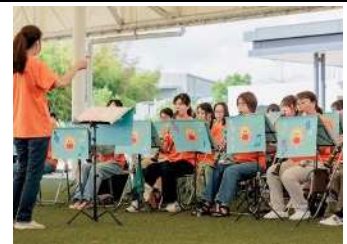
月2回の訪問演奏を中心に活動しています▲

「子どもがいても吹奏楽を楽しみたい」という想いから誕生した半田市を拠点に活動する吹奏楽団です。演奏依頼やメンバーの募集状況はホームページをご確認ください。お子様連れの練習参加も大歓迎です。