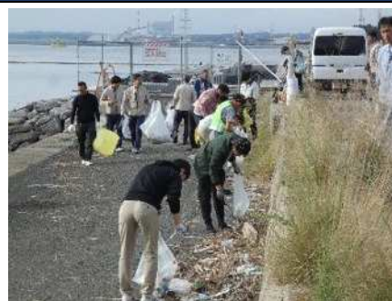
▲水辺クリーン・アップ大作戦