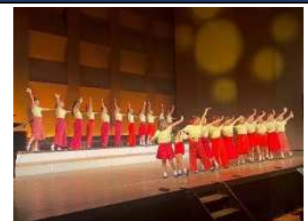
2025年8月31日第6回コンサートより▲

「歌うって楽しい!」「舞台って気持ちいい」をキャッチフレーズに、イベントやコンサートに出演し活動の輪を広げている幼児から中学生までの合唱団です。定期演奏会ではオリジナルミュージカルも発表しています。知多半島春の国際音楽祭やセントレア空港音楽祭にも出場しています。