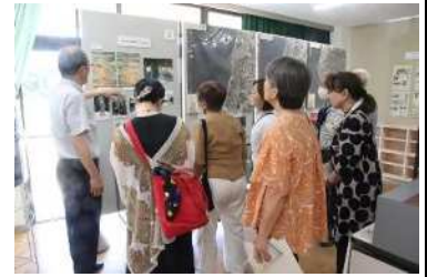
▲ 各地の戦争と平和に関する資料館の見学もしています ▲

半田市は大太平洋戦争中に大規模な空襲を受け、大きな被害が出ました。また、1958年には、世界で最初に核非武装宣言を行った都市です。この半田市に、戦争と平和のための資料館を設立しようという市民運動の団体です。