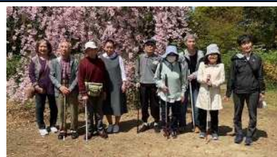
▲雁宿公園でお花見をしました。

視覚障がいの方々へ耳よりな情報を録音したCDをお届けしたり、視覚障がいの方々も一緒に楽しめるサロンを開催しています。たまには、みんなでお出かけしたりもします。自分も楽しむついでに、ちょっとお手伝い…そんな仲間を募集しています。