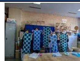
染色体験者の作品▲

半田市立博物館の活動に協力し、郷土の文化遺産を守ることを目的としています。具体的には機織り・染色・陶芸・古文書・歴史の部会別に活動し、合同事業として展示会・見学会等を行っています。