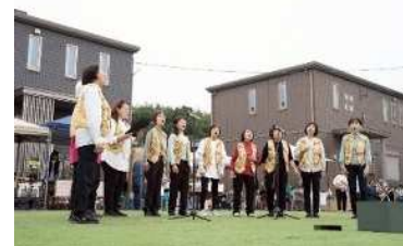
▲はあ〜いマルシェ、イベントにて

今年結成 30 周年の女声コーラスグループです。メンバーの殆どがシニアになりましたが、「気持ちと声は若々しく」をモットーに楽しく歌っています。随時メンバー募集をしていますので、覗きに来ていただけたら嬉しいです。