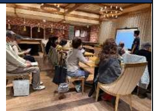
南生協病院研修医を講師に招き▲クラシティで健康講座

となり近所のつきあいが希薄になり、つながらなくてもすむ時代。誰にも相談できず孤立化がすすんでいます。南医療生協は、地域の人と人がつながる「班会」を基礎に、健康づくり、おたがいさまのまちづくりをすすめています。毎月のように健康講座や健康チェックなどのイベントを行っています。