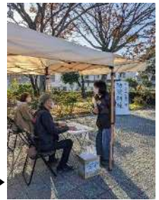
安否確認訓練の様子▶

活動日時 ①②：随時、③：毎週水曜日 8:30～10:00、夏場 8:00～9:30