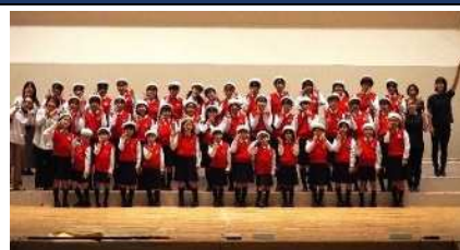
▲第46回定期演奏会にて 「いい顔いい声いい心」を合い言葉

1969年創立の児童合唱団。半田市及び近隣市町から通う小学生から大学生までの50名が在籍。合唱活動を通して子ども達の豊かな感性と人間性を養います。異年齢の仲間とともに一つの舞台を創り上げる経験は生涯に渡るかけがえない宝物になります。長年地域の文化芸術の振興にも貢献してきました。