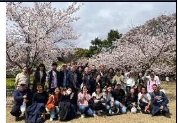
▲日本語教室後のお花見

半田市の姉妹友好都市（アメリカ ミッドランド市、オーストラリア ポートマッコリー、中国 徐州市）との交流を支援する活動や、外国籍市民のための日本語教室、多文化共生に向けた市民向け講座・イベント等の開催を行っています。ご興味のある方、当協会活動にご参加・ご協力ください。