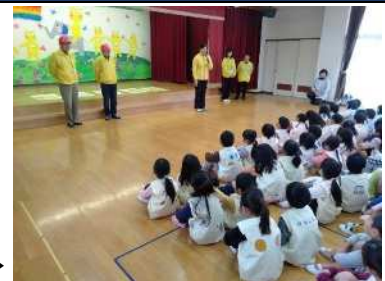
幼稚園での防災教室▶

地震や台風など災害発生後、被災者の早期復旧のため社会福祉協議会による災害ボランティアセンター立上げを補助すると共に、支援に訪れる災害ボランティアを効率よく被災者宅へ派遣するコーディネートの実施を目的としています。平常時は、子どもを含む多くの皆様への防災意識の啓発に努めています。