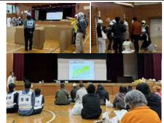
宮池小学校 避難所開設訓練▲

災害時に備えて、一緒に活動してくれる仲間を絶賛募集中！ いざという時のために、今から考えていきましょう！