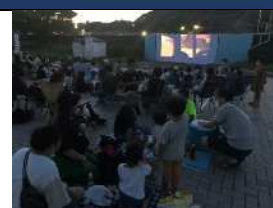
亀崎お月見座（野外映画の夕べ）▲

亀崎に現存する伝統ある歴史、文化を守り、次世代へ繋ぐことを継続しながら、まちおこし、人づくり事業を展開し、まちを再生、繁栄させ、みんなが元気になれるまちを目指すことを目的としています。