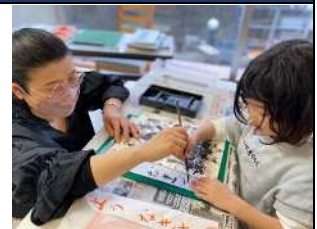
習字教室の風景（第2第4土曜日開催）▲

「あなたの隣を歩いて行きたい」を合言葉に、介護保険事業（デイサービス・ケアプラン作成）・喫茶・各種教室（絵手紙・習字・ヨガ・認知症予防教室）・一般アパートへの入居契約の困難な方への住まいの提供・若者の夢の応援・子育て支援等を行っています。