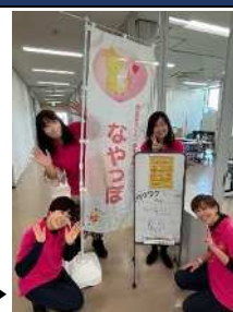
不定期で対面イベントもやっています▶

子育ての不安やモヤモヤを、一人で抱え込まなくていいように。オンライン個別相談を中心に、気持ちをそのまま話せる“安心の居場所”を届けています。小さな一步を一緒につくる活動です。