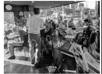
▲ 音楽とミニ法律学習のつどい

日々の暮らしの中で起きる小さな問題から人生を左右する大きな問題まで、人権とは何か、法律とは何かを学び合って解決に結ぶための会です。