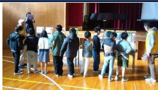
▲亀崎小学校での防災教室の一コマ

活動日時 依頼者との相談により決定 活動場所 要望される場所に出動します。 問い合わせ 電話：090-4183-4158（大竹） メール：m-ohtake@qc.commufa.jp