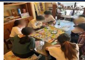
▲ボードゲームで交流中

社会活動や働くきっかけを探している方へ、過ごす場（居場所）と工賃支給のある軽作業の場（働く）の提供をしています。心や体の不調、お金、コミュニケーション、就労等の悩みを抱えながら、今後の在り方を考え、次のステップへの準備が行えます。