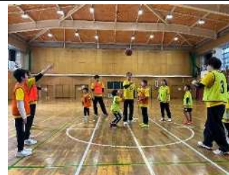
▲小学生チームのゲーム

活動日時 ①基本、毎月第1土曜日 13:00～14:30、15:00～16:30