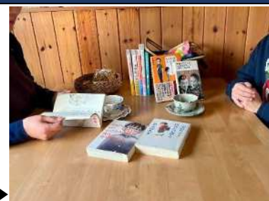
読書や近況報告など、安心できる仲間と過ごす時間▶

不登校やその傾向にある子の悩みを持つ保護者が安心して話せる場を作りたいと思い団体を立ち上げました。立ち上げた私達も同じように不登校の子を持つ保護者です。当事者同士だからこそできる情報の交換や支え合いの交流等で、心をゆるめて我が子なりの成長を見守れるようになることを目指しています。