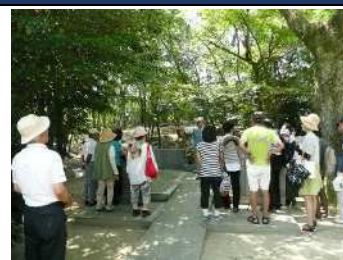
▲戦跡巡りのガイド派遣の様子

半田及び知多半島の戦争、戦跡の調査記録をし、戦争体験者の証言を記録、集約、発表しています。戦跡巡りのガイドの派遣、小学校での平和学習への講師派遣、半田空襲・震災犠牲者追悼式の運営、戦争と平和についての学習会の実施を行っています。