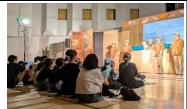
▲第305回高学年例会 人形劇団ひとみ座「シュレミールと小さな潜水艦」観劇

子どもたちが自ら考える力は「あそび」の中で育ちます。生の舞台に出会って心を揺さぶられる体験。そこで得た豊かな感性は、子どもたちのあそびに繋がっていきます。乳幼児、小学生、中高青年から大人まで、幅広い年齢の仲間と豊かな人間関係をつくりあうことを大切に活動しています。