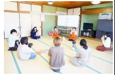
▲ベビーサイン講座の様子

あかちゃんと肌を通してふれあうベビーマッサージ、おててで話すベビーサイン、思い出づくりのおひるねアート・手形アート・アルバムカフェなど、あかちゃんといっしょに参加できる体験会や講座、イベントを開催しています。ご家族みなさんがあかちゃんとの生活を楽しめるよう、お手伝いします♪