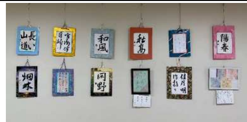
▲年1回開催の「書作品展」

・書を楽しむ会：今では日本文化となった書道を外国人に紹介する場。または紹介できるよう日頃から自ら楽しんで研鑽する場。