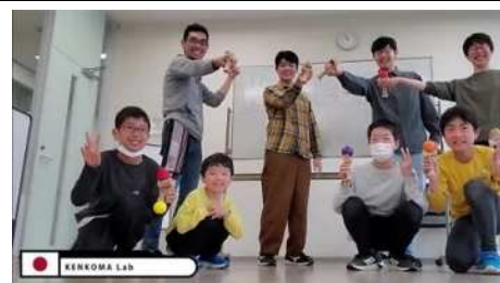
▲けんこま研究室、遊びに来てね！

けん玉やこままわしが好き、これから始めてみたいなど、初めての方も大歓迎です。道具の貸出有ります。世代を超えて楽しめるスキルトイ。「できた！」の喜びを分かち合い、育ち合う、そんな温かい居場所になればと思います。気軽に遊びに来てください。