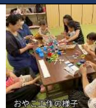
おやこ工作の様子

託児活動などを通じて、子育て真っ最中の方を応援・サポートしています。小さなお子さんとパパ・ママがゆったりできる「あそぼう会」を月1回開催し、季節に合わせたイベントや工作・わらべうた・絵本の読み聞かせなどを行っています。