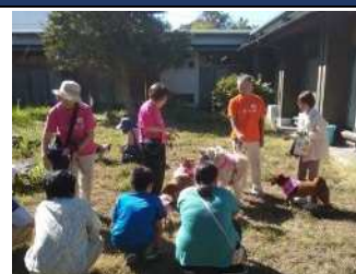
毎月第2木曜日にセラピー犬やボランティア犬▲

不登校やひきこもりで困っている保護者の方が少しでも元気になれるような相談活動と小学生以上を対象に学校でもない、塾でもない、治療施設でもない安全で安心できる居場所を運営しています。また、中学生以上を対象に毎週木曜日の午後に学習支援をしています。